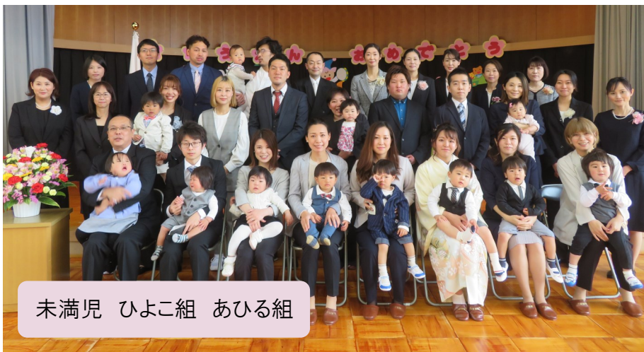
未満児 ひよこ組 あひる組

保育目標『明るく元気にやる気をもって、みんなとなかよく遊ぶ子』を掲げ、保育教育していきます。園児を主体に楽しい保育をしていきます。