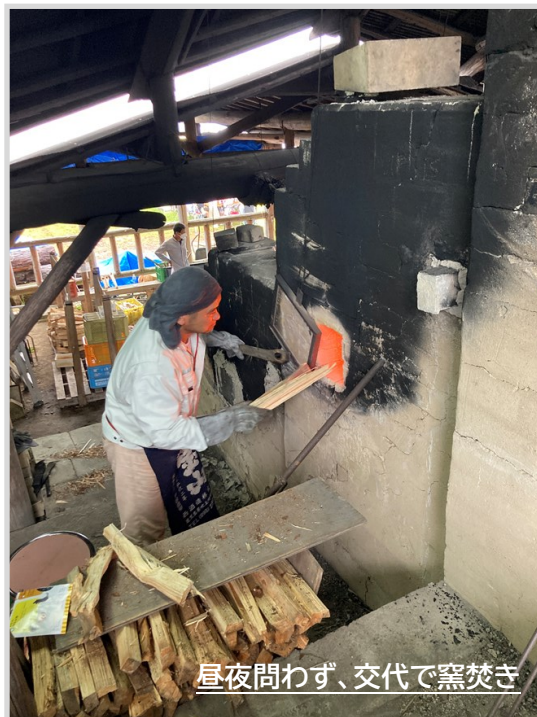
昼夜問わず、交代で窯焼き